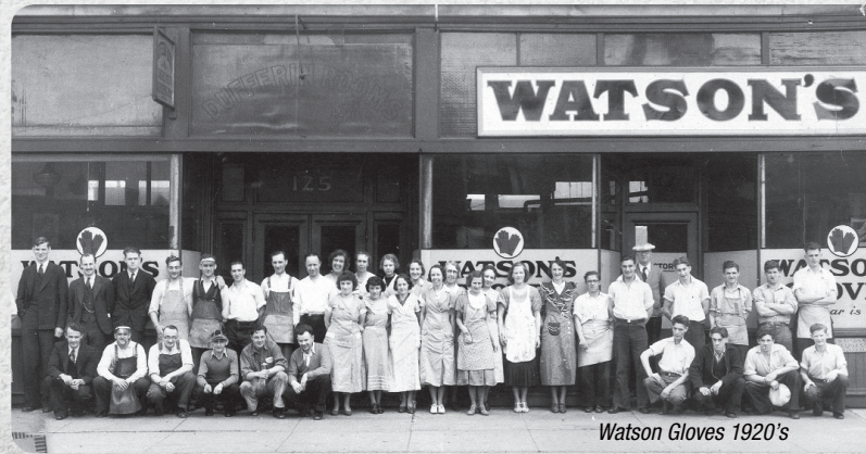
Watson Gloves 1920's