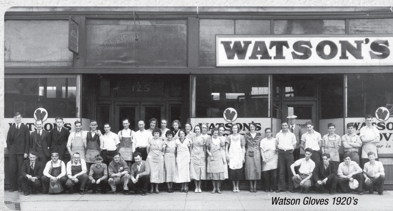
Watson Gloves 1920's

L'innovation: Nous nous engageons à posséder une longueur d'avance sur nos clients en anticipant leurs besoins et en offrant les gants les plus perfectionnés pour presque tous les ouvrages possibles.